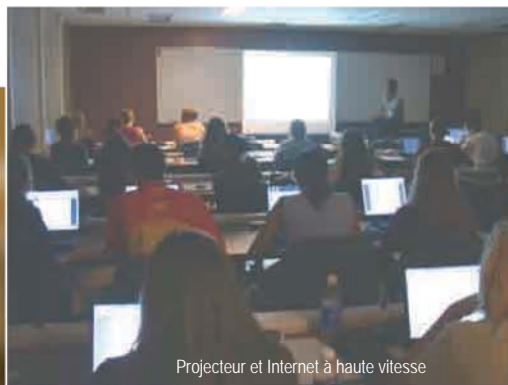
Projecteur et Internet à haute vitesse

Technologie de l'architecture, Génie civil, Informatique et Techniques de bureautique, microédition et hypermédia