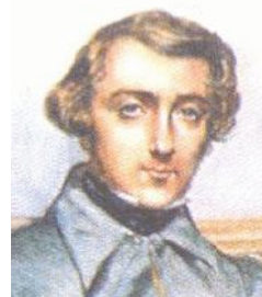
Alexis de Tocqueville