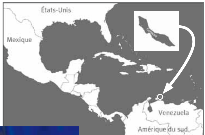
Carte : Daniel Dalet

De retour au Canada, avec la distance géographique, Alan Cranshaw remarque