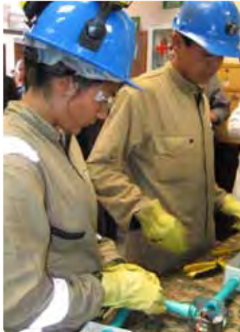
Des travailleurs miniers en formation

Rappelons que le Collège Montmorency collabore avec le Cégep de Saint-Laurent à un projet de coopération internationale, dans la région des Andes. Financé par le ministère des Affaires étrangères, Commerce et Développement Canada, le programme Éducation pour l'emploi (ÉPE) est géré par l'Association des collèges communautaires du Canada (ACCC). D'une durée de trois ans, le projet vise à mettre en œuvre une offre de formation professionnelle et technique afin que l'exploitation minière artisanale soit sécuritaire, saine et compatible avec la préservation de l'environnement en Colombie. Les deux cégeps viennent en appui au SENA.