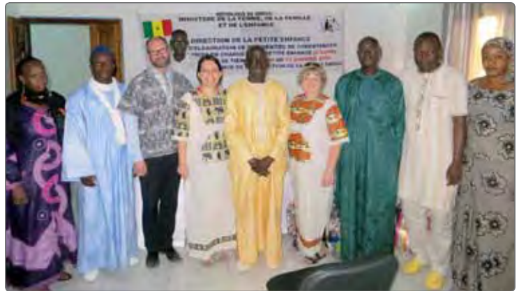
Les trois professeurs montmorenciens, entourés des représentants de la Direction de la petite enfance du Sénégal

Les discussions qui ont suivies ont non seulement permis d'amorcer l'élaboration d'un document qui servira de référentiel à la formation des futures éducatrices dans les crèches communautaires, mais elles ont également contribué au développement d'expertises disciplinaires et culturelles des différents intervenants présents lors des ces journées d'atelier. Ces échanges furent un véritable lieu de mise en commun des efforts de prise en charge, en plus d'être une source de connaissance de complémentarité des pratiques, mœurs et coutumes des deux pays. L'équipe montmorencienne, fière du travail accompli, mais consciente qu'il reste encore beaucoup à faire, souhaite poursuivre le projet en participant, entre autres, à la finalisation des éléments de contenu du référentiel de formation ainsi qu'aux premières formations que recevront les futurs intervenants sénégalais.