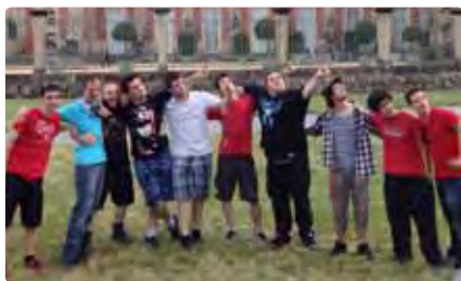
Étudiants devant le Nouveau Palais de Potsdam, résidence pour les invités du roi