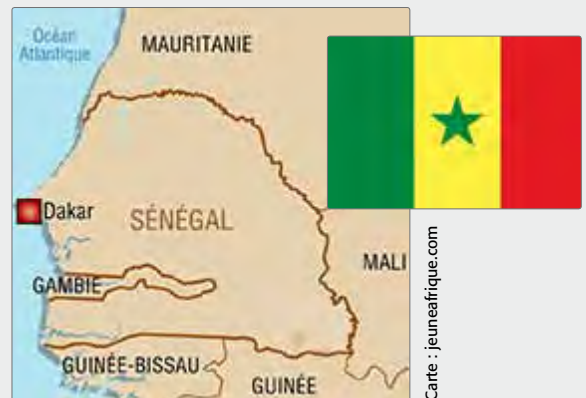
Carte : jeuneafrique.com

Source : Programme des Nations Unies pour le développement