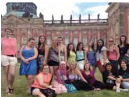
Étudiantes devant le Nouveau Palais

Pour sa musique, ses peintres, son architecture, sa nourriture, l'Allemagne continue de fasciner nos étudiants. À elle seule, la ville de Berlin compte plus de 175 musées, dont la fameuse île aux musées, déclarée patrimoine mondiale de l'Unesco. Il y en a pour tous les goûts. En se rendant à la Philharmonie de Berlin, orchestre dont la réputation dépasse les océans, nos étudiants sont émus par l'immense beauté de ce qu'ils entendent.