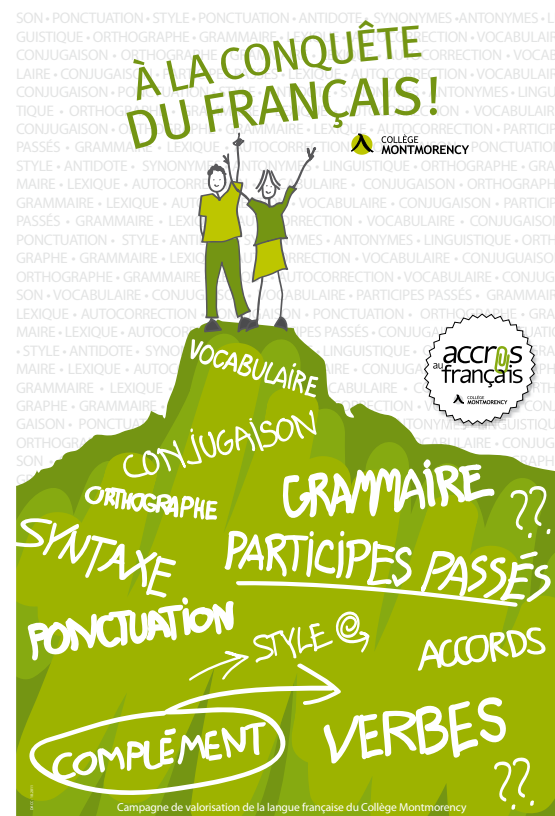
L'affiche officielle de la campagne de valorisation de la langue française