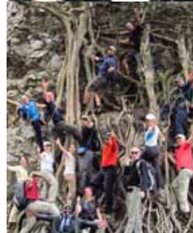
En haut, au Pic Uhuru, on exhibe fièrement un chandail aux couleurs du Collège Montmorency.