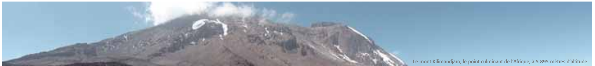
Le mont Kilimandjaro, le point culminant de l'Afrique, à 5 895 mètres d'altitude