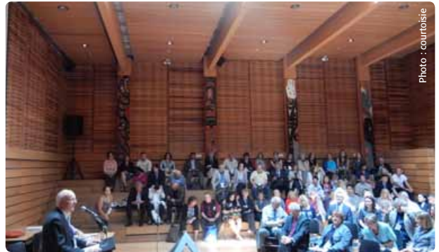
L'assemblée générale annuelle de la commission canadienne pour l'UNESCO

Dans le cadre de mon doctorat en philosophie de la biologie, j'ai pris part à la 8 e conférence annuelle du Consortium d'histoire et de philosophie de la biologie, qui se tenait à l'université de Cambridge en Angleterre, les 26 et 27 juin 2014. Ce consortium regroupait cinq