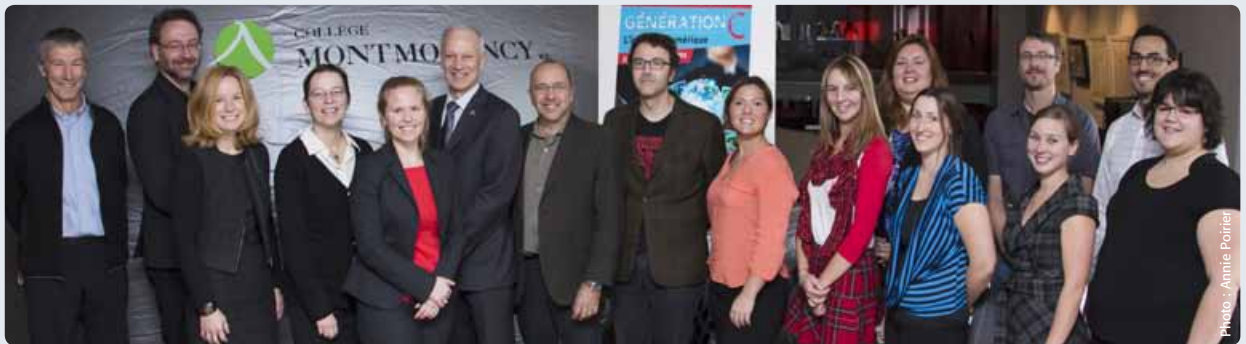
Les partenaires ainsi que les membres du personnel du Collège Montmorency impliqués dans la Quinzaine.

La Quinzaine des sciences est un projet financé dans le cadre de l'Entente spécifique en matière de culture scientifique et technique. Elle compte de nombreux partenaires qui contribuent chaque année à l'élaboration d'une programmation riche et diversifiée.