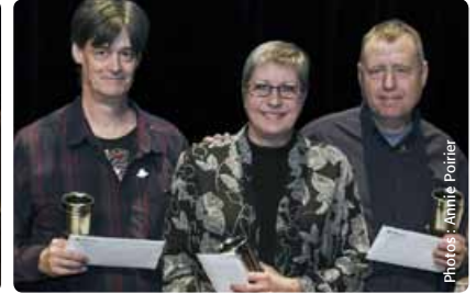
35 ans de service