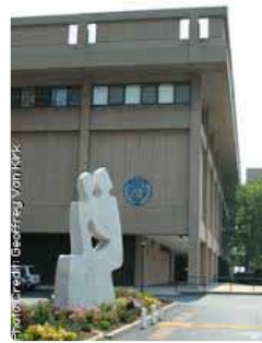
Le siège de l'ONU près de l'East River à New York