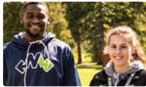
Des étudiants Nomades bénévoles, lors du tournoi de golf

Le 18 septembre 2014, une centaine de golfeurs se sont réunis au Club de golf Rosemère afin de prendre part à la Classique Desjardins au profit des Nomades. Grâce aux commanditaires, donateurs et participants, un montant de 33 500 $ a été amassé. Cette somme sert à acheter du matériel sportif et à offrir des soins de physiothérapie aux étudiants-athlètes du Collège.