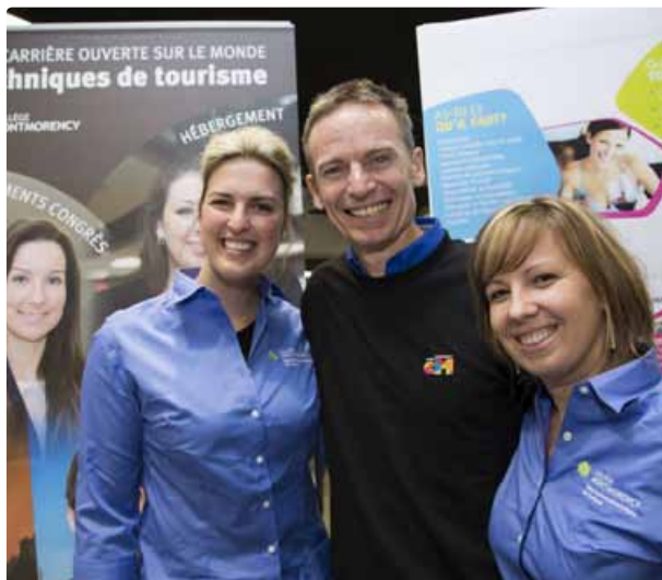
Le Département de techniques de tourisme a été très actif aux portes ouvertes avec ses étudiants guides, ses diplômés et ses professeurs.