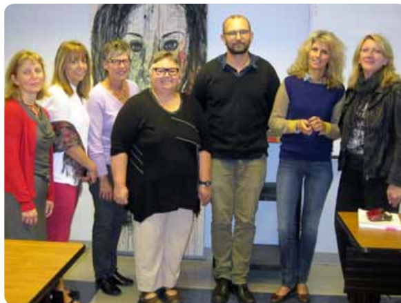
La Direction des études et le Département de techniques d'éducation à l'enfance ont accueilli 23 étudiants en gestion du Collège Coopératif Rhône-Alpes de Lyon (France) pour un après-midi conférence.

Issus de divers secteurs de la santé et des services sociaux, le groupe de 23 étudiants français effectuait un voyage d'études à Montréal, du 14 au 20 septembre dernier. Parmi eux, on trouvait des éducateurs de jeunes enfants, des éducateurs spécialisés, des assistants de service social et des infirmiers. Tous se destinent à des