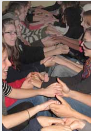
Par des jeux coopératifs, une dynamique de groupe commence à s'installer lors du camp.

La sélection des participants s'est faite après le départ des campeurs, le dimanche soir. À partir de leurs observations, des résultats du ques-