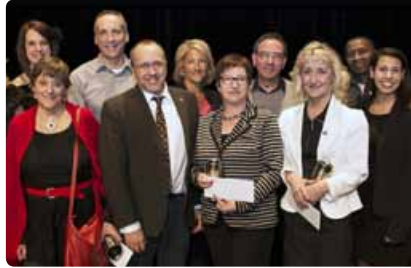
30 ans de service