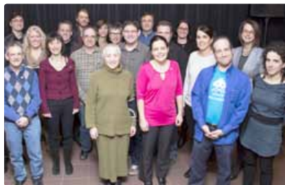
Dans l'ordre : 10, 15 et 20 ans de service. Voyez la galerie photo au http://bit.ly/1xZaiPl .

de les remercier de façonner notre cégep d'aujourd'hui, une institution reconnue dans le réseau collégial pour son dynamisme et pour son sens de l'innovation.