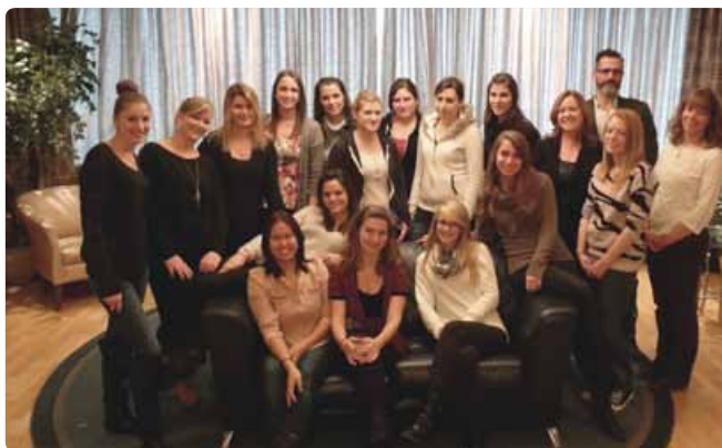
Les stagiaires française, accompagnées de quelques étudiantes et professeurs du Département de techniques d'éducation à l'enfance

Le « choc » culturel fut grand pour la plupart des stagiaires, mais fort intéressant. L'organisation du travail de l'éducatrice comporte certaines similitudes et plusieurs différences, surtout au chapitre du travail d'équipe. La comparaison des différences entre le Québec et la France a permis tant aux étudiantes françaises qu'aux