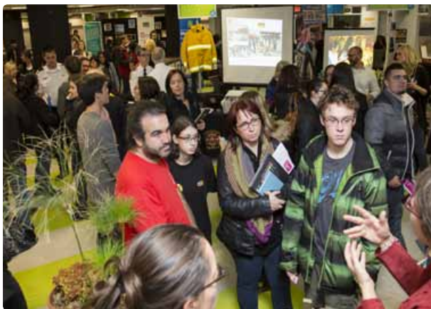
L'agora était pleine à craquer !

Consultez la nouvelle section « Visite du Collège » au http://www.cmontmorency.qc.ca/visite-du-college/portes-ouvertes . Vous y trouverez la galerie photo des portes ouvertes 2014.