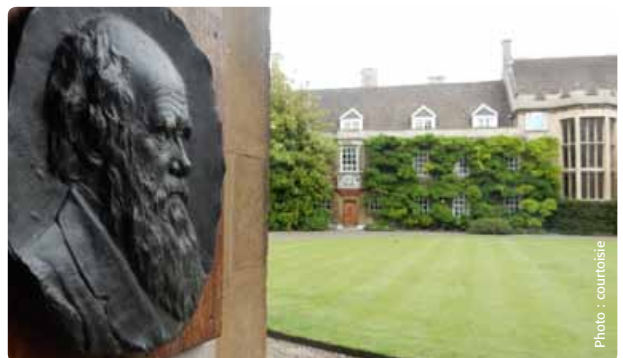
Une plaque en hommage à Charles Darwin, au Christ's College, University of Cambridge