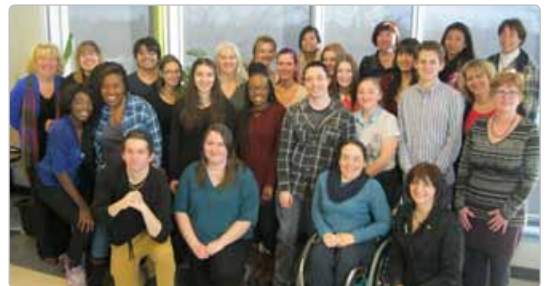
Remise des attestations en Microédition et hypermédia