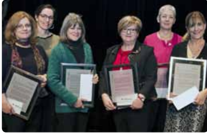
25 ans de service

Voyez la galerie photo au http://bit.ly/1JPuU28 .