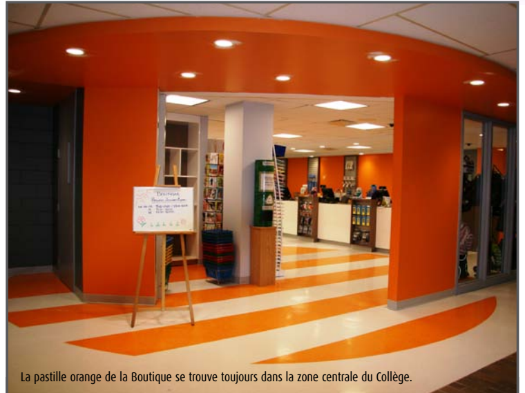
La pastille orange de la Boutique se trouve toujours dans la zone centrale du Collège.