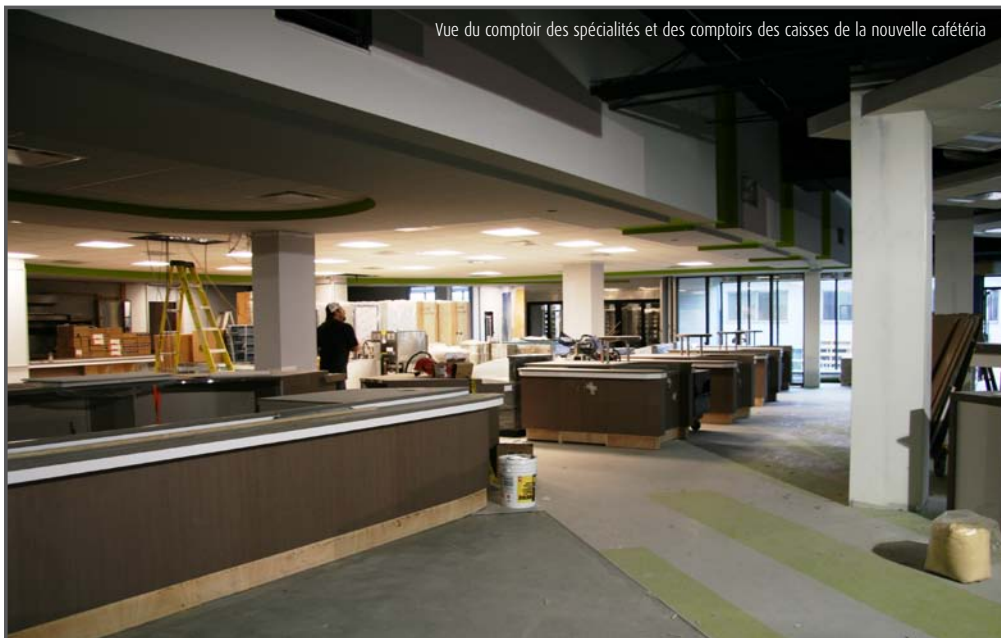
Vue du comptoir des spécialités et des comptoirs des caisses de la nouvelle cafétéria