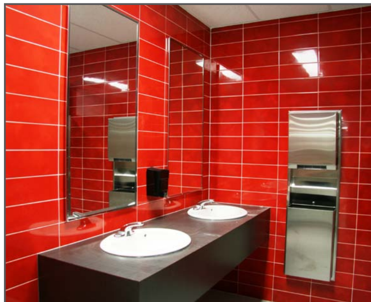
De nouveaux blocs sanitaires (femmes en rouge et hommes en vert) sont maintenant accessibles près du couloir qui mène aux départements de physique et de Techniques de tourisme.