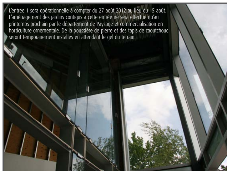
L'entrée 1 sera opérationnelle à compter du 27 août 2012 au lieu du 15 août. L'aménagement des jardins contigus à cette entrée ne sera effectué qu'au printemps prochain par le département de Paysage et commercialisation en horticulture ornementale. De la poussière de pierre et des tapis de caoutchouc seront temporairement installés en attendant le gel du terrain.