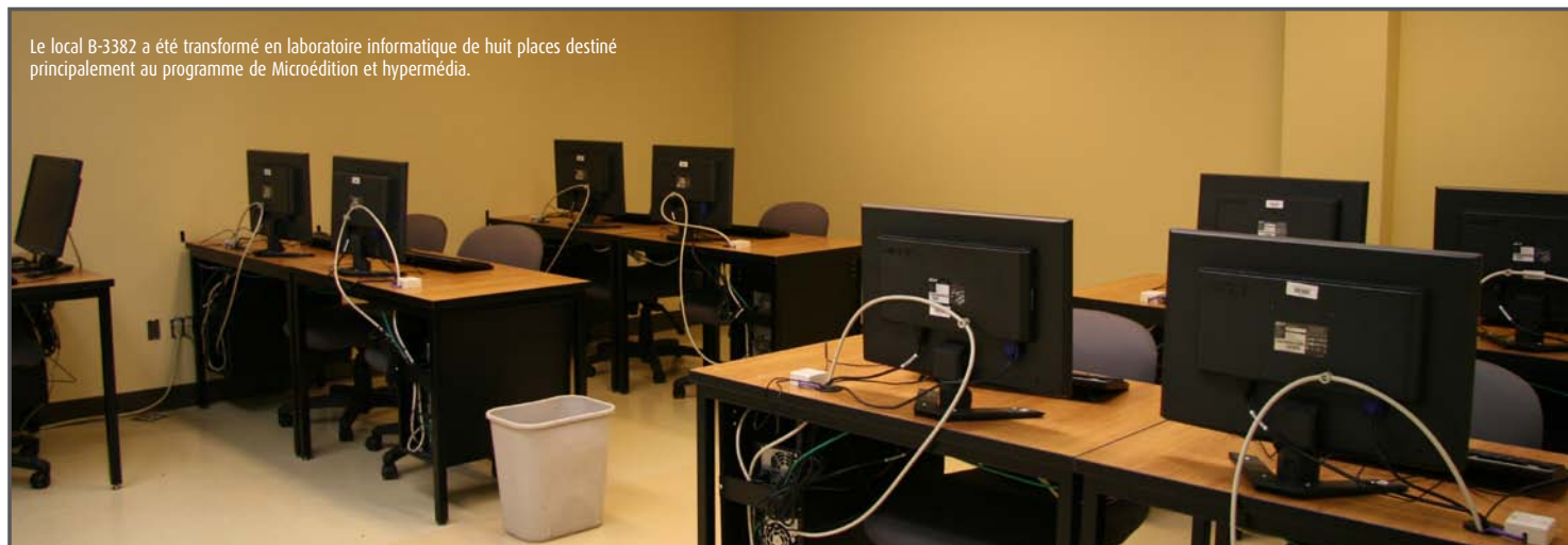
Le local B-3382 a été transformé en laboratoire informatique de huit places destiné principalement au programme de Microédition et hypermédia.

Afin de répondre aux besoins d'espace des départements de Gestion d'un établissement de restauration et Diététique, des bureaux de professeurs de philosophie ont dû être déplacés. Par ailleurs, les locaux libérés par le département de biologie dans le Complexe modulaire ont été de nouveau transformés en classes.