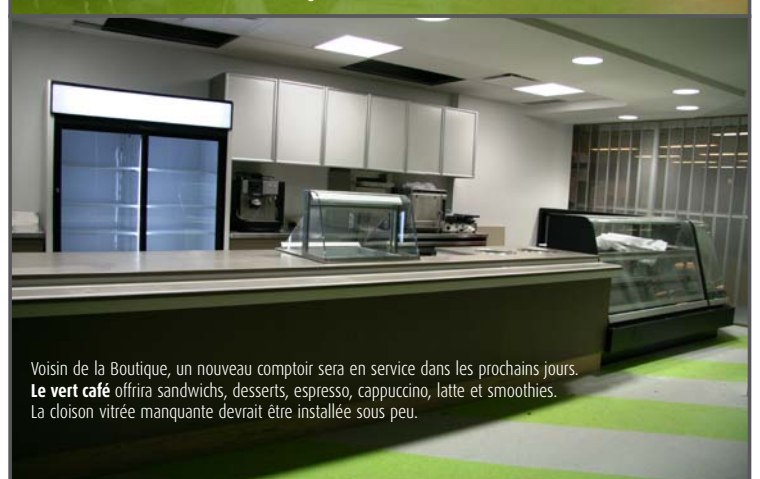
Voisin de la Boutique, un nouveau comptoir sera en service dans les prochains jours. Le vert café offrira sandwiches, desserts, espresso, cappuccino, latte et smoothies. La cloison vitrée manquante devrait être installée sous peu.