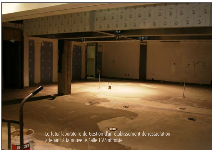
Le futur laboratoire de Gestion d'un établissement de restauration attenant à la nouvelle Salle L'A*mbroisie.

Les travaux de la nouvelle Salle L'A*mbroisie et du laboratoire de Gestion d'un établissement de restauration seront complétés d'ici la fin du mois d'août tel que prévus.