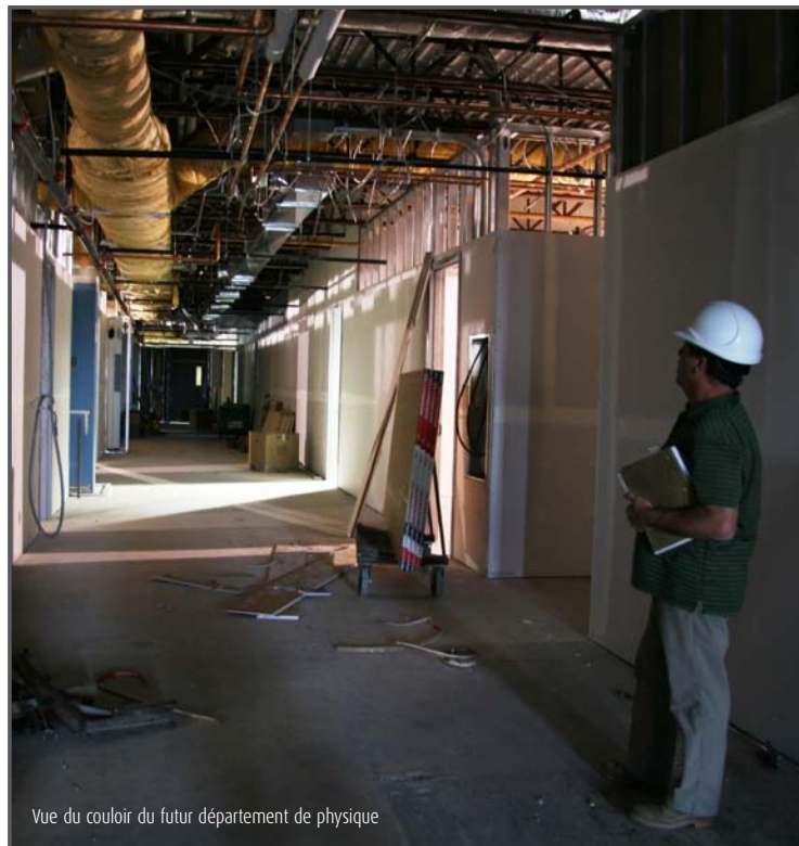
Vue du couloir du futur département de physique

Le département de chimie a libéré ses anciens locaux du Bloc C, qui, une fois réaménagés, accueilleront quatre laboratoires du département de physique, trois locaux pour les professeurs, un bureau pour les techniciens, un dépôt/magasin, une salle de rencontre départementale, ainsi que cinq classes communes. La ventilation et la mécanique ont été réalisées, les cloisons sont montées et le tirage des joints est en cours. Les travaux s'effectuent rondement. L'ensemble de ce chantier sera livré dès la mi-septembre, selon l'échéancier prévu.