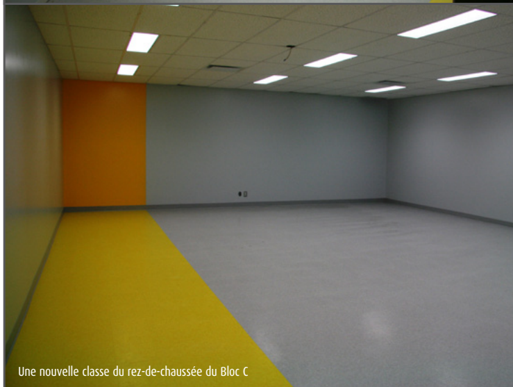
Une nouvelle classe du rez-de-chaussée du Bloc C