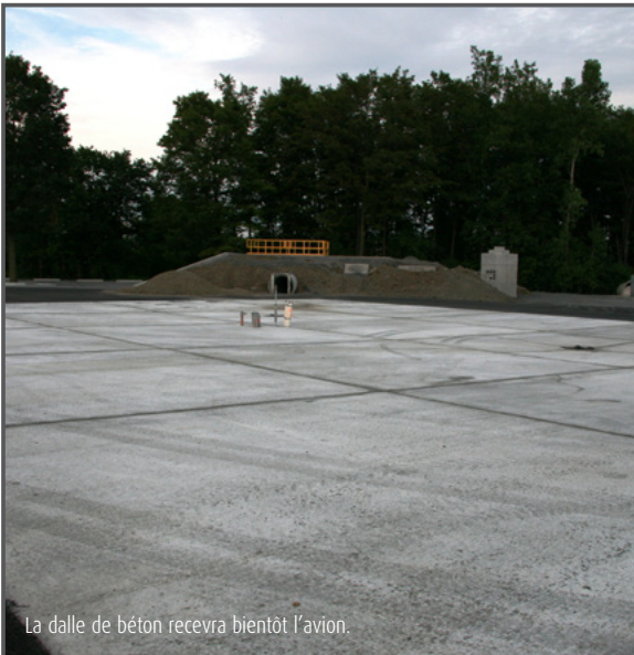
La dalle de béton recevra bientôt l'avion.