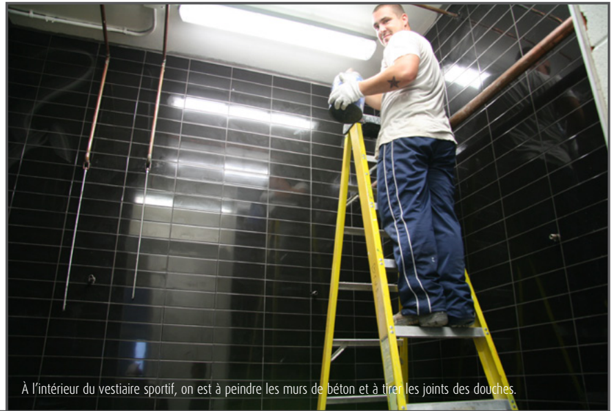
À l'intérieur du vestiaire sportif, on est à peindre les murs de béton et à tirer les joints des douches.

Le Complexe de sécurité incendie est fin prêt pour recevoir l'avion sur ses sites d'entraînement extérieur. La tranchée a été complétée. La phase d'excavation et du coulage de la dalle de béton est terminée. L'avion a été désassemblé sur la Rive-Sud. Il sera remonté à Laval et fixé aux ancrages dans les prochaines semaines. Pour voir le démontage des pièces de l'avion, on visite le site http://www.casair.info/Viscount/VISCOUNT.html .