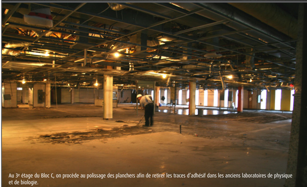
Au 3 e étage du Bloc C, on procède au polissage des planchers afin de retirer les traces d'adhésif dans les anciens laboratoires de physique et de biologie.