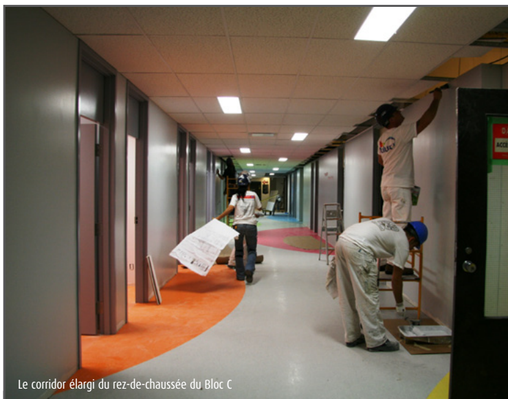
Le corridor élargi du rez-de-chaussée du Bloc C

Le comptoir de l'audiovisuel revient près de l'ascenseur au C-1501 et sera ouvert le 18 août 2011.