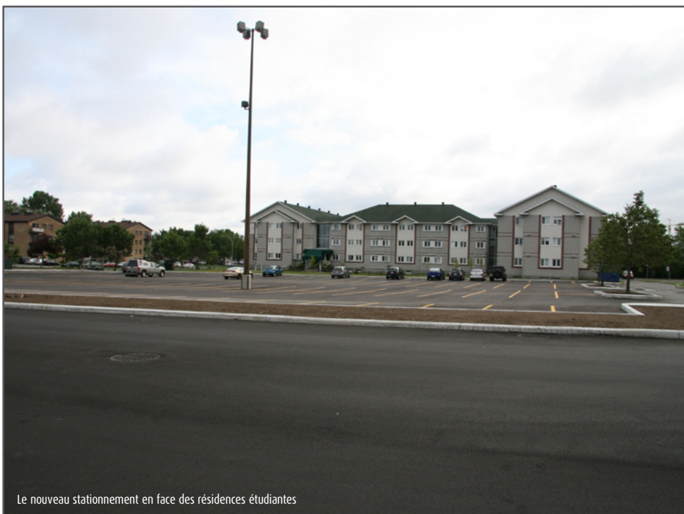
Le nouveau stationnement en face des résidences étudiantes

L'asphaltage du nouveau parc automobile situé en face des résidences étudiantes a été complété cet été. On y compte 156 places de stationnement.