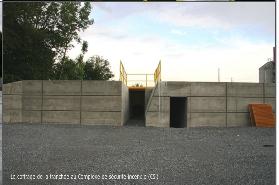
Le coffrage de la tranchée au Complexe de sécurité incendie (CSI)