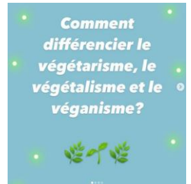
Première publication #végééquilibre de l'année sur la page Instagram

Abonnez-vous à la page eco.momo sur Instagram! De nombreux conseils s'y trouvent pour vous inciter à devenir,