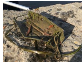
Masque retrouvé dans la Rivière-des-Mille-Îles par les étudiants du comité Équilibre

L'utilisation des masques jetables (masque de procédure) en cette période de pandémie est très préoccupante pour l'environnement. Quand ils ne sont pas jetés par terre pour éventuellement polluer les milieux naturels, ils s'ajoutent aux matières accumulées dans les sites d'enfouissement ou brûlés dans les incinérateurs selon les municipalités.