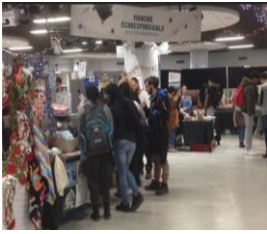
Marché écoresponsable au Collège Montmorency en 2019

Cette année, offrons des cadeaux québécois à nos proches! Malgré le fait que les grandes multinationales américaines comme Amazon prennent le pouvoir tous les ans en cette période des Fêtes, n'hésitez pas à prendre le temps de chercher des petites entreprises d'ici qui offrent des produits aussi intéressants, abordables et même de meilleure qualité. Le Marché écoresponsable du Collège Montmorency n'a malheureusement pas eu lieu cette année, alors voici quelques liens qui peuvent vous aider dans vos recherches. Que ce soit des jeux de société , des produits pour le corps , des pochettes de téléphones , des romans ou des accessoires de cuisine , on peut tout trouver localement. Votre bonheur sera décuplé, car en plus de faire plaisir à vos proches, vous ressentirez la profonde satisfaction d'avoir encouragé des artisans et des commerçants d'ici et d'être écoresponsable en diminuant votre empreinte carbone!