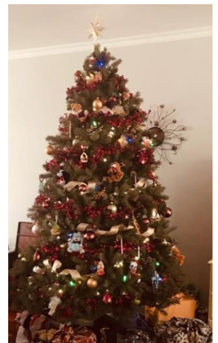
Sapin de Kelly Ann qui emballe ses cadeaux avec de jolis tissus

Pour plus d'information, communiquez avec myriam.broue@cmontmorency.qc.ca